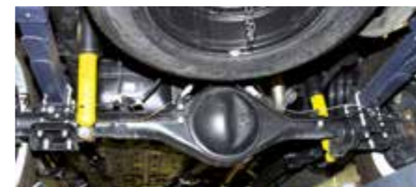
NUOVE BALESTRE E NUOVI AMMORTIZZATORI POSTERIORI E ANTERIORI, TUTTI OME SPORT

e preservare al meglio la meccanica ci pensano le protezioni in duralluminio, che vantano uno spessore di 8 mm e sono posizionate una nella parte inferiore del motore e l'altra sotto al cambio. Della protezione dei passeggeri invece si occupa il cromatissimo rollbar, accessorio originale Toyota che, oltre alla sua funzione principale, svolge anche un compito estetico non da poco! La vasca di protezione del cassone, non certo votata alle prestazioni in offroad, sembra un'idea azzeccata soprattutto per chi deve caricare materiale di un certo peso su terreni sconnessi. Utile, ma anche bella a vedersi, la sua copertura rigida, ulteriore elemento che contribuisce a incrementare la versatilità del mezzo, in grado ora di ospitare anche oggetti più delicati senza la preoccupazione del meteo.