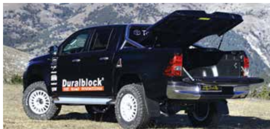
BELLA E UTILE LA COPERTURA RIGIDA DEL CASSONE, ORIGINALE TOYOTA

problemi di aderenza. Il rialzo di 6 centimetri offre tutti i vantaggi del caso, primo fra tutti la maggiore luce a terra, che aumenta anche grazie ai nuovi pneumatici montati su cerchi Braid più grandi di quelli di serie (da 17") e di colore bianco, altro elemento caratteristico che