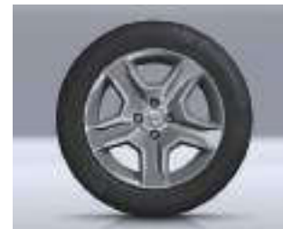
CERCHI DA 16" FLEXWHEEL BAYADERE DARK METAL