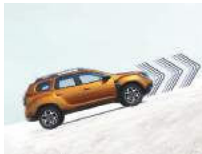
ASSISTENZA ALLA PARTENZA IN SALITA