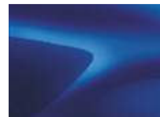
BLU IRON (VM)