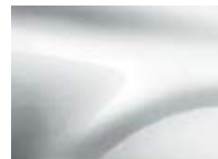
BIANCO GHIACCIO (VO)