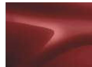
ROSSO FUSION (VM)

(VM) Vernice metallizzata (VO) Vernice opaca