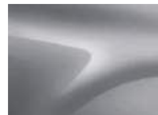
GRIGIO MAGNETE (VM)