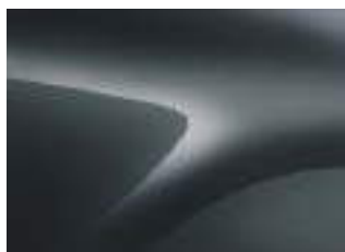
GRIGIO COMETA (VM)