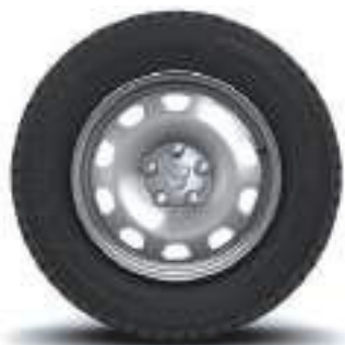
CERCHI IN ACCIAIO DA 16"