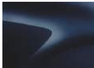
BLU NAVY (VO)