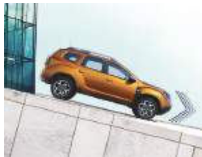
SISTEMA DI CONTROLLO IN DISCESA