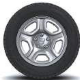
CERCHI IN ACCIAIO DA 16" FIDJI