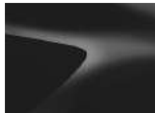
NERO NACRÉ (VM)