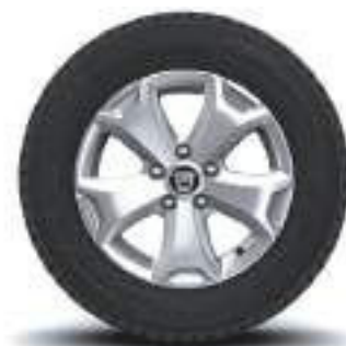
CERCHI IN LEGA DA 16" CYCLADE