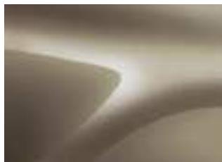
BEIGE DUNA (VM)