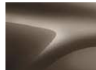
BRUN VISON (VM)