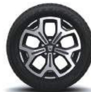
CERCHI IN LEGA DA 17" MALDIVES