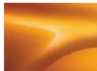
ORANGE ATACAMA (VM)